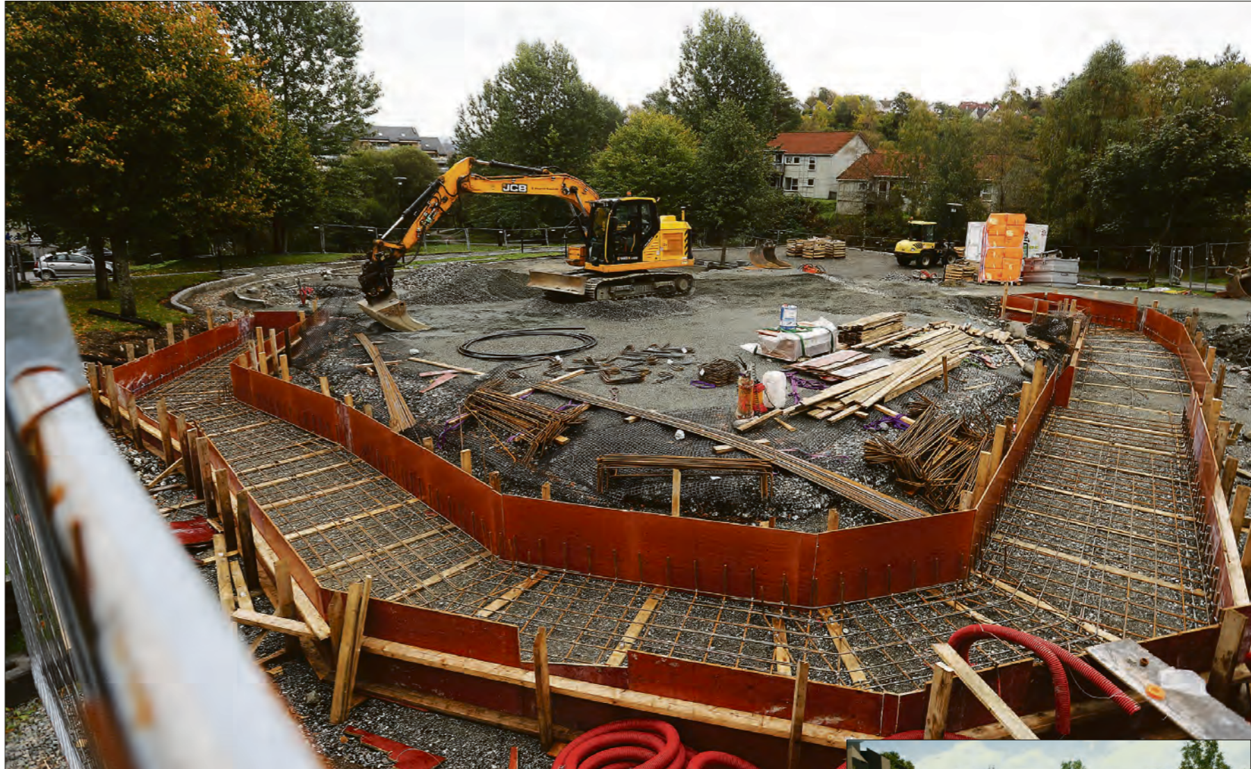
GRUNNARBEIDER: Grunnarbeidene er allerede godt i gang, og man kan tydelig se hvor den nye støyskjermen skal komme.

AURDALSLIA: Mens det ropes på fysak og ungdomstilbud, har kommunen i det stille gått i gang med bygging av ny aktivitetspark skreddersydd for 10-18-åringene i Ytrebygda.