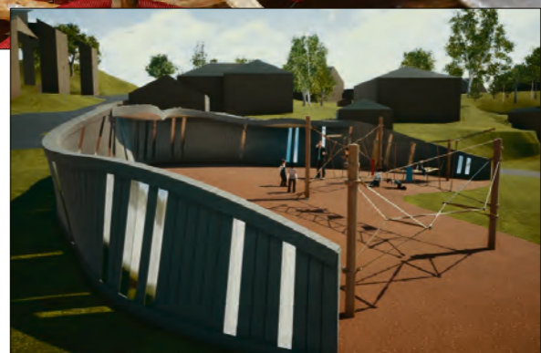
SLIK: Støyskjermen skal bli et gjenkjennelig element i nabolaget.

Til slutt: Fanatorget lokalpark er en av to parker som er på trappene i Bergen sør. En liknende park er også på gang på Skjoldstølen, på den kommunale lekeplassen like ved Skjoldtun barnehage. Den kan du lese mer om i en fremtidig utgave av Fanaposten.