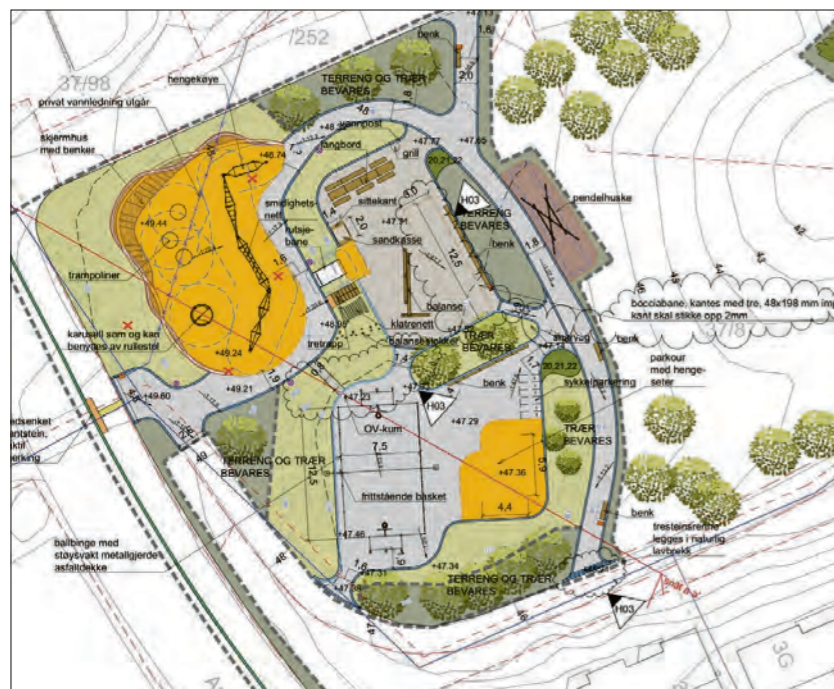
SLIK: Her er skissen som viser nye Fanatorget lokalpark.